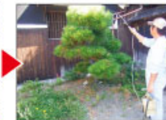
植木剪定・害虫防除